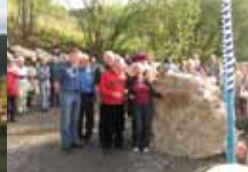
Coppenbrügger Platz, „Balkon von Veldenz“