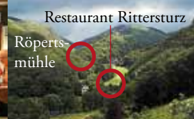
Hinterbachtal mit Schloss