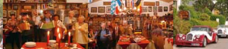
Feiern in unserer Antiken Festhalle