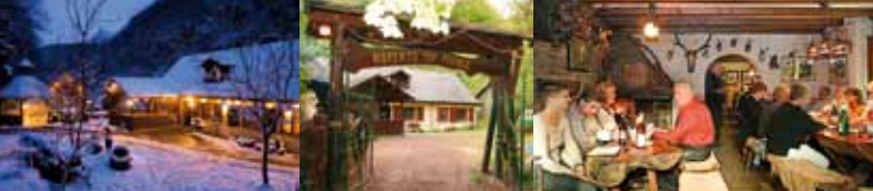
Grillabende und Weinproben in der „Röperstmühle“ im Hinterbachtal