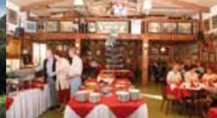
unsere Antike Festhalle