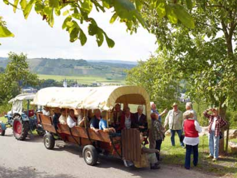
Planwagenfahrt auf Anfrage