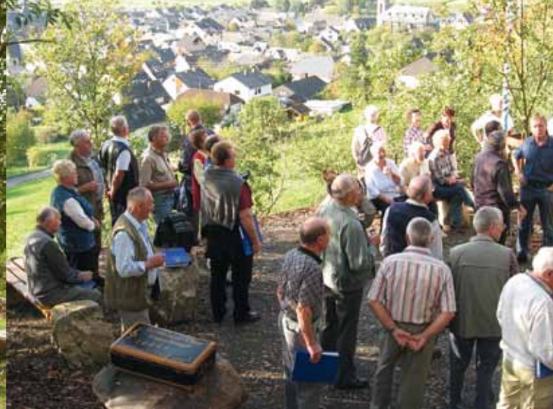
Unser Copenbrügger Platz : Gästebrennplatz